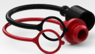
Tampa Protetora Para Engate Rápido Hidráulico